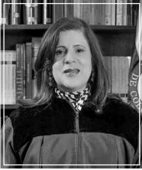
Magistrada Ponente Rocío Araújo Oñate